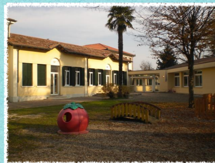
ZANETTI-MENEGHINI Via Varotara n.10 Zianigo