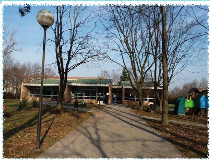
COLLODI Via C. Battisti n. 105 Mirano