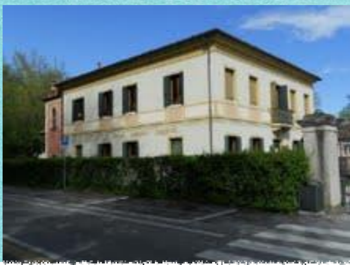
VILLA SAGGIOTTI Via Belvedere n.2 Mirano

Open-Day online Lunedì 14 Dicembre 2020 ore 17.00